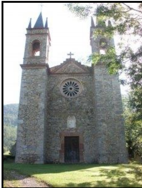
Santuari del remei

(350 m) En quinze minuts us trobareu amb un trencall. Si voleu anar a veure el Santuari del Remei heu d'agafar la pista que puja cap a l'esquerra, és opcional ja que després haureu de tornar al mateix trencall però són tan sols 10 minuts de pujada i molt recomanable per veure la gran construcció en un paratge singular.